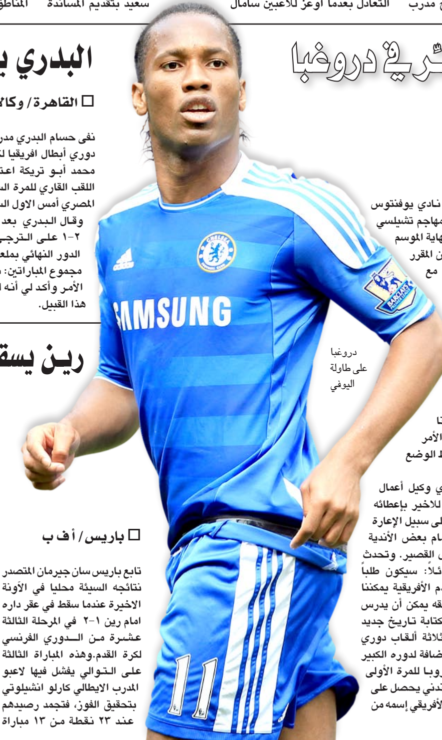
دروغبا على طاولة اليوفي

بالتساوي مع مرسيلايا الثاني الذي لعب مباراتين اقل، في حين حقق رين فوزه السادس في آخر سبع مباريات واصبح رابعا موقتا. وخاض سان جيرمان المباراة في غياب هدافه السويدي زلاتان ابراهيموفيتش ومامانو ساخو والهولندي غريغوري فان در فيل بسبب الايقاف، وماتيو بودمير وكريستوف جالييه والايطالي نياغو مونا بسبب الإصابة. افتتح المتألق رومان اليساندريني التسجيل للضيوف عندما اطلق تسديدة يسارية رائعة على مدخل منطقة الجزاء أنهلت جماهير ملعب بارك دي برانس ليسجل هدفة الرابع هذا الموسم (١٣)، لكن بعد ٨ دقائق عادل البرازيلي نيني العائد من الإصابة عندما اخترق منطقة الجزاء وسدد كرة