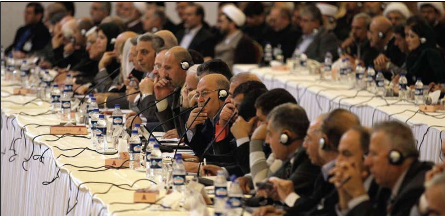
ممثلين عن الحكومة السورية والمعارضة يستمعون إلى وزير الخارجية الإيراني علي أكبر صالح في طهران