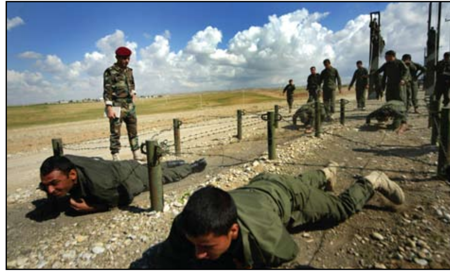
البشركة تجري تدريبات في معسكر قرب اربيل وسط دعوات لعدم زج القوات المسلحة في الصراع السياسي..

وقعت في منطقة تتمتع بغالبية تركمانية. وطالب كهيئة الجيش العراقي بعدم اللجوء إلى القوة المفرطة في تعامله مع القوات المحلية، لأن ذلك يعيد إلى الأذهان استخدام الجيش العراقي المنحل في عهد النظام السابق القوة المفرطة ضد بعض المكونات العراقية. وفي هذا السياق اعرب نبيل حربو عضو القائمة العراقية