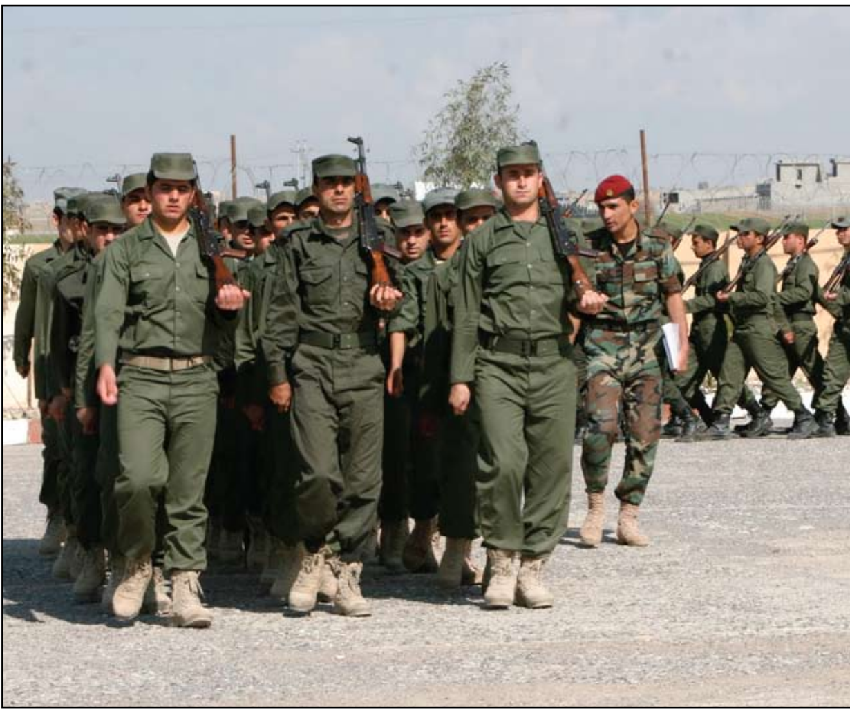
قوات البيشمركة.. (أرشيف)